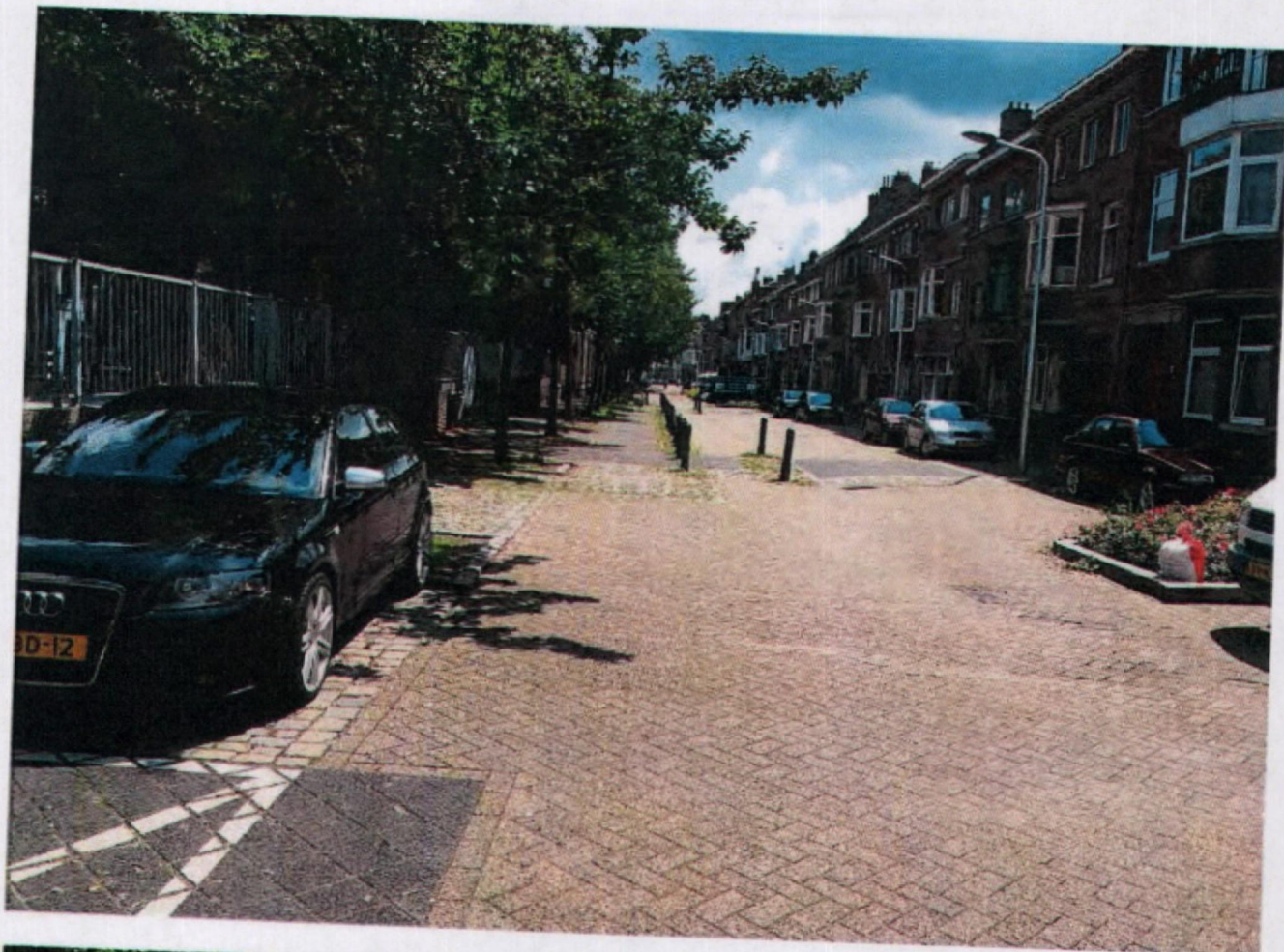
VICTOR DE STUERSTR. 2