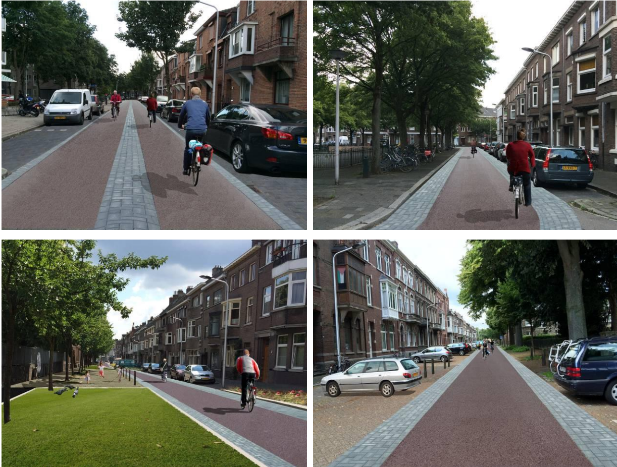
Afbeelding 3. Visualisaties toekomstbeeld v.l.n.r. Orleansstraat, Orleansplein en Victor de Stuerstraat